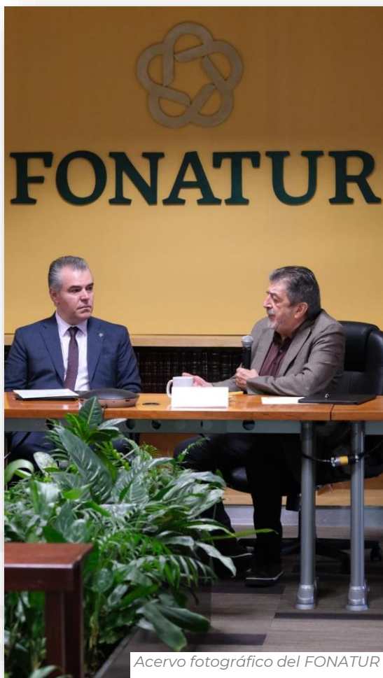
Firma de convenio entre el FONATUR y la CONCAMIN.

tecnologías que son ambientalmente amigables y que permiten reducir el uso de recursos finitos así como utilizar recursos existentes de forma más eficiente, son los siguientes: