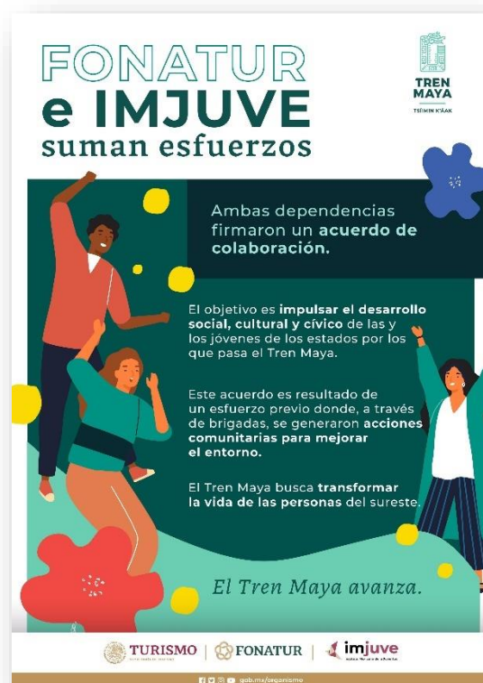
Infografía sobre la colaboración entre el FONATUR y el IMJUVE.