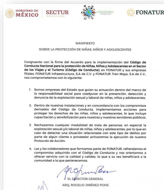
Manifiesto firmado por el Director General del FONATUR sobre la Protección de Niñas, Niños y Adolescentes.

Adicionalmente, el 24 de febrero de 2021, el Fondo y el Instituto Mexicano de la Juventud (IMJUVE) firmaron un convenio marco de colaboración para impulsar y fortalecer el desarrollo social, cultural, económico y cívico de las y los jóvenes en los estados que