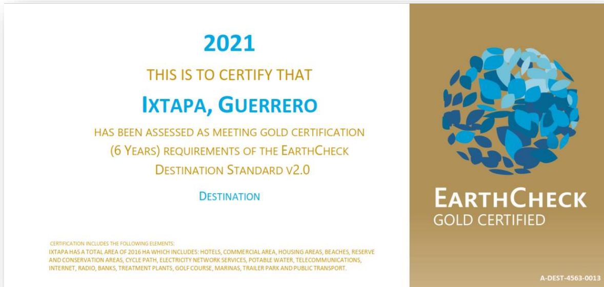
Certificación EarthCheck de Ixtapa, Guerrero.