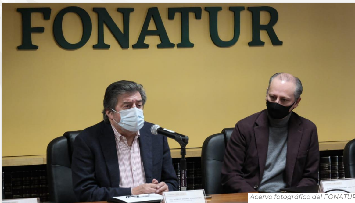
El FONATUR y el INAES buscan impulsar la economía social y solidaria en la región del Tren Maya.

El objetivo del convenio es fomentar la inclusión económica y sustentable con la participación organizada de las personas que habitan la región que recorrerá el Tren Maya, con un especial énfasis hacia los jóvenes, indígenas y mujeres, mediante la generación de capacidades, la planeación territorial, creación y fortalecimiento de empresas de economía social como cooperativas y de procesos de formación que dinamicen las relaciones económicas y sociales en el territorio.