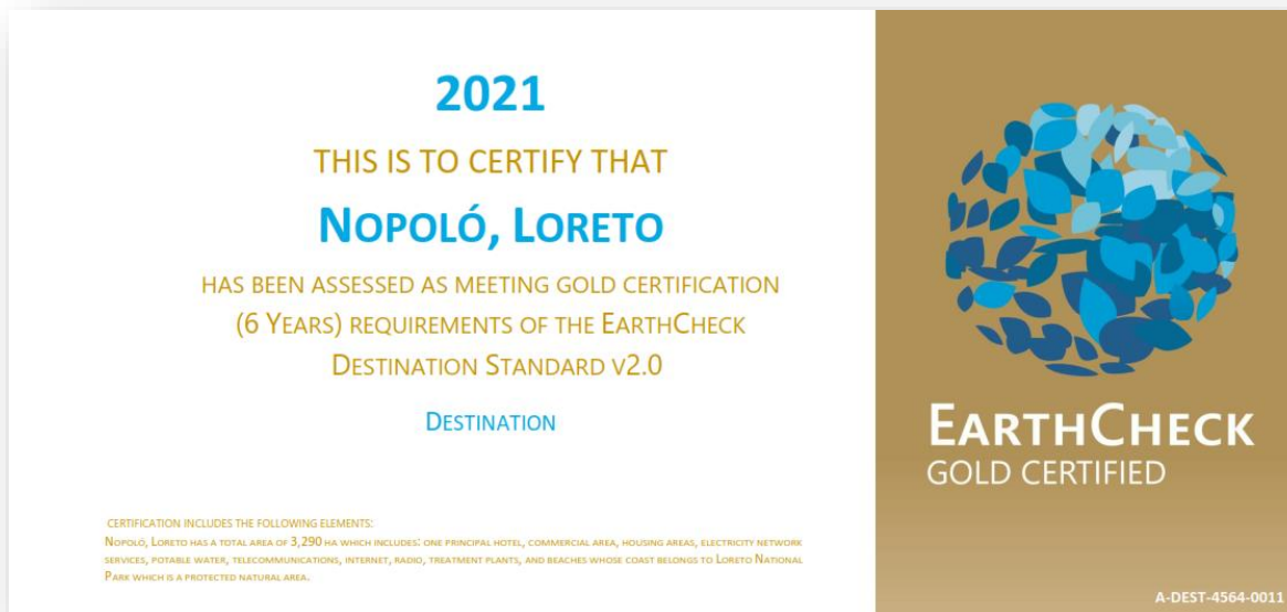
Certificación EarthCheck de Nopoló, Loreto.

incorporación del fortalecimiento y salvaguarda del patrimonio cultural y natural de la zona de influencia del proyecto del Tren Maya.