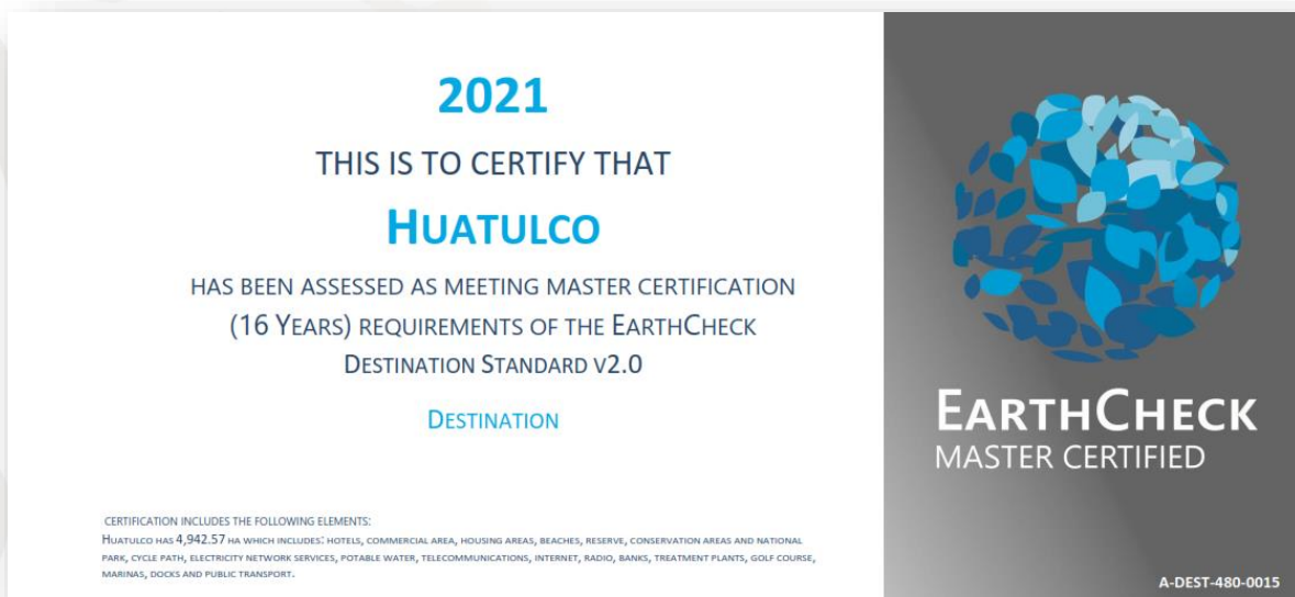
Certificación EarthCheck de Huatulco.

En el CIP Nayarit, como resultado de implementar mejores prácticas ambientales en el Campo de Golf de Litibú, se obtuvo la